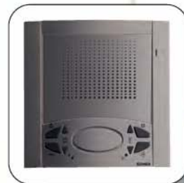
Barva kartáčovaná ocel