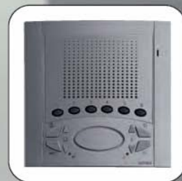
Barva šedá titanová