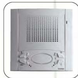
Barva bílá standardní

V digitálních systémech "Due Fili Elvox" a "Digi Bus" je kromě základní řady s 8 tlačítky také verze s 6 přidavnými programovatelnými tlačítky (celkem 14), pro interkomunikační výzvy nebo doplňkové funkce.