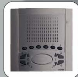
Barva kartáčovaná ocel