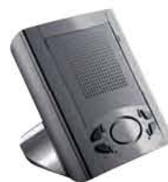
Verze na stůl

Barvy: bílá (standardní barva), šedá titanová (art. 66../37), kartáčovaná ocel (art. 66../40) Materiál: kopolymer