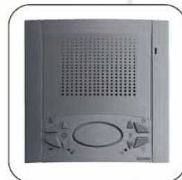
Barva šedá titanová