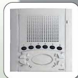
Barva bílá standardní