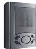
Verze na povrch